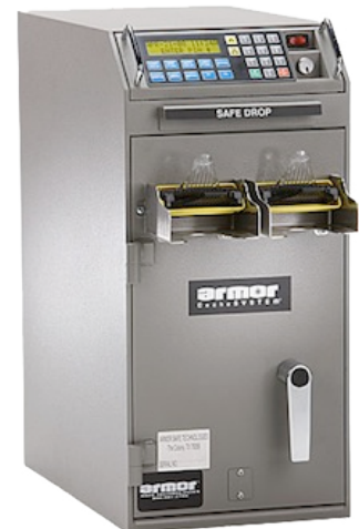
CS-2492 (dos validadores de billetes por pacas)