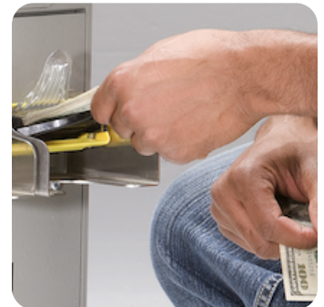
Carga hasta 50 billetes en paca por cada charola