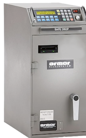
CS-2461 (un validador de billetes sencillo)

Comunicar: La serie 2400 integra el amigable software CacheTALK™ III que le permite al usuario acceder y evaluar información de las transacciones proveyendo comparaciones en tiempo real con la actividad de los puntos de venta (POS).