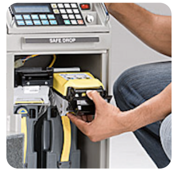
Fácil remoción para mantenimiento

Cada caja Armor Safe incluye un completo manual de usuario y una guía rápida de referencia para iniciar. Sesiones individuales o grupales de entrenamiento también están disponibles (opcional).